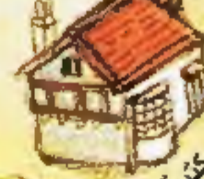
مخينة بريس بيلاك